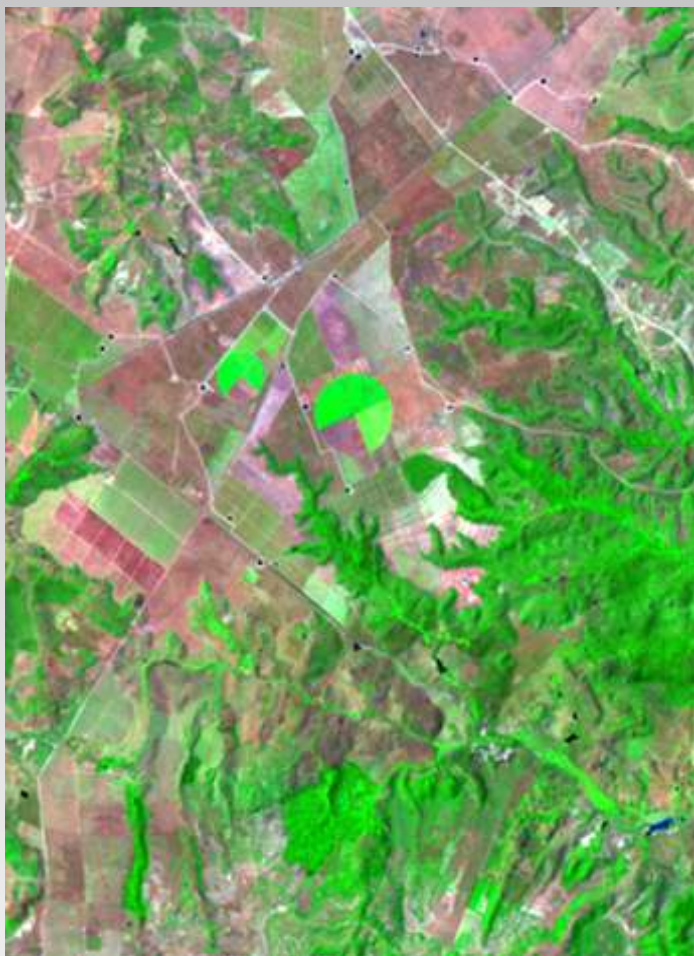
Região de Tabuleiros Costeiros do Estado de Sergipe.